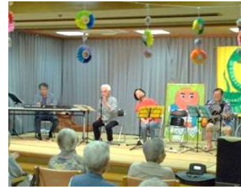
夕焼けフレンズ様