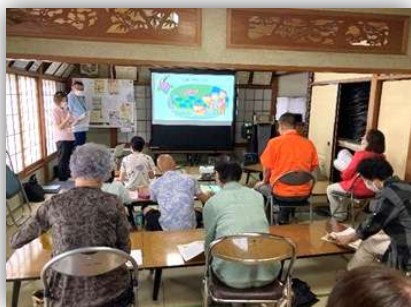
認知症サポーター養成講座

熟年相談室(地域包括支援センター)では区民の方に向けて 各種講座やカフェを開催しています。