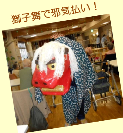
獅子舞で邪気払い！