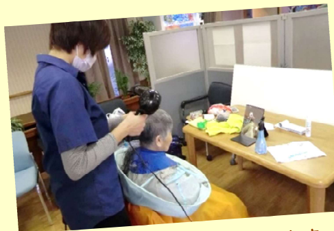
理美容サービスも行っています (ふれあい・くつろぎ)