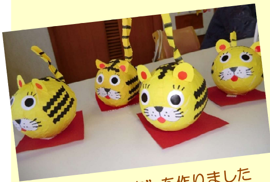
千支の置物“寅”を作りました