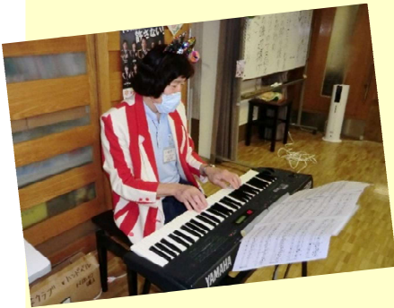
職員による演奏 衣装も着て気合入ってます！

新型コロナウイルス感染症対策のため活動内容が限られ悩ましいところですが、三密の対策を取りながら共同作品やクラブ活動、体操を行っています。