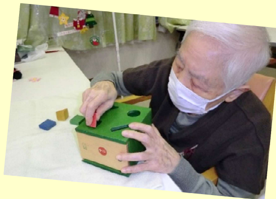
パズルボックスで 脳トレ 真剣です

これからも皆様に安心してサービスを利用して頂けるようご利用者様、職員の健康観察を続け、体調の把握に努めてまいります。