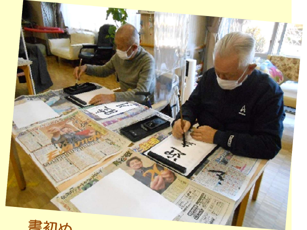
書初め デイサービスも新しい一年が始まりました！

型にはまった活動はなく一人ひとりの興味、関心を探り楽しみのある場所を提供しています。