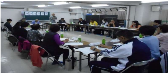
【2019年度の地域連携会議の様子】

熟年者の暮らしを支える総合相談窓口の熟年相談室では、毎年、地域を変えて地域連携会議を開催しています。